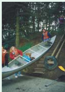
Flere steder skal kanoen bæres over en mindre strækning.

På de strækninger, hvor man må sejle, må man de fleste steder kun benytte kano, kajak eller robåd. Til længere sejlads er kano eller kajak langt at foretrække. At sejle i kajak kræver dog megen teknik og dygtighed, og langt de fleste vælger at tage turen i kano.