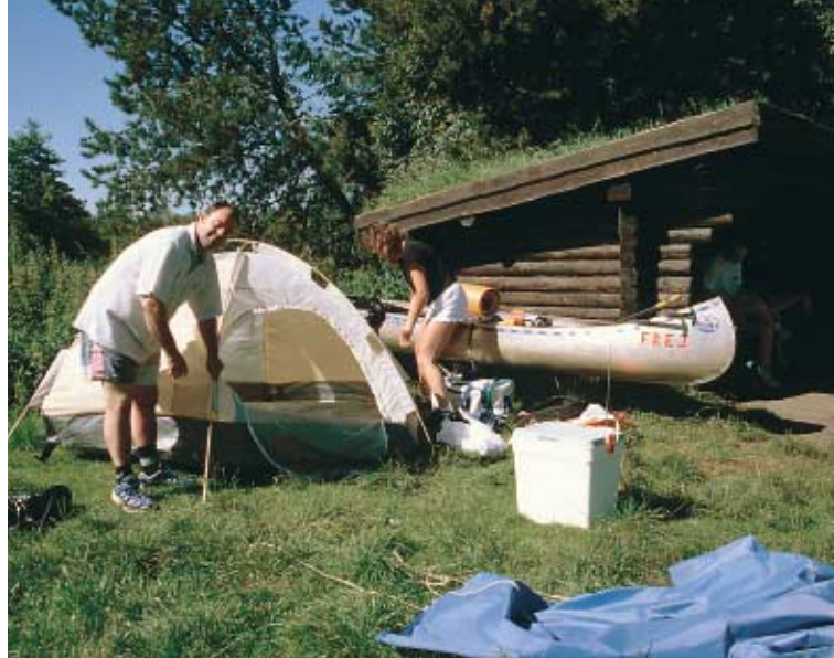
Ved Karlsgårde Sø er der etableret en primitiv overnatningsplads for vandrere og kanosejlere.

Lodsejere må sejle ud for egen grund hele året.